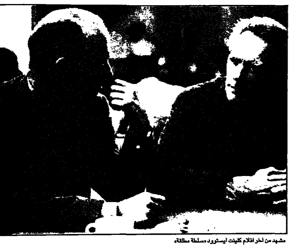
مشهد من اخراج كلينت ايستوود سلطة مظلمة

باريس - القدس العربي: من لا يعرف للمثل والخرج الشهير كلينت ايستوود؟ من وعادة يقرب الى اللغز هاري، الى الخرج الهوليوودي، حقق انجازات رائعة في ميداني التمثيل والخراج. اضافة الى ذلك انه مسجون بيوستيفي الجاز والد الموسيقي التصويرية لفيلمه دون شقة، وطريق مادسون، وظهر له مؤخرا اسطورة عن موسيقي الجاز الكلاسيكية. ابنه مورغان 6 اشهر ملا حياته بهجة وفرحاً وبزواجه من الصحافية دينا رويز وضع حدا لكل مغامراته العاطفية الذائبة الصيت.